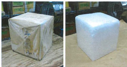
▲この1包25kgの立方体が、ドライアイスの基本的なサイズ